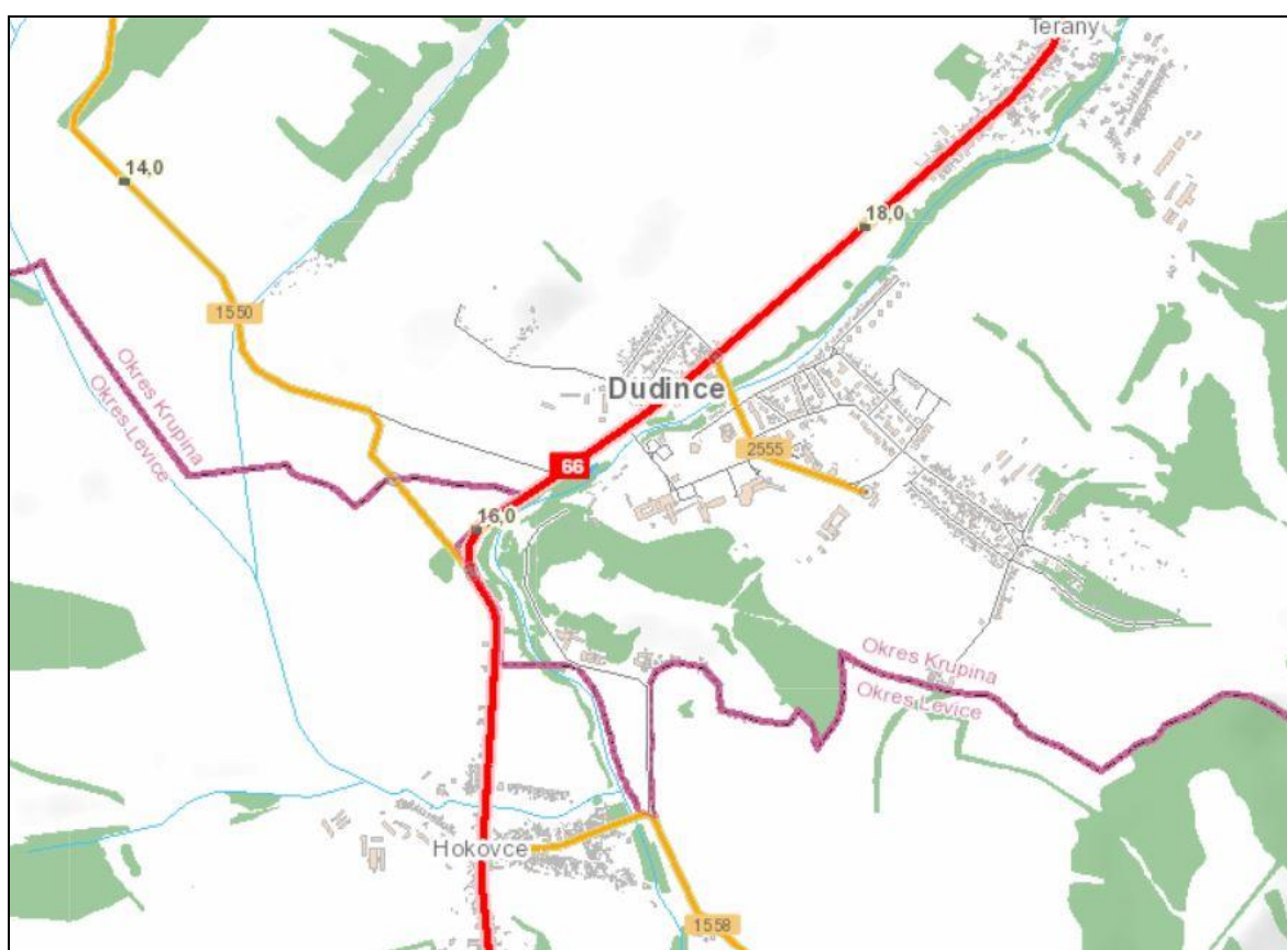
Grafické znázornenie ciest v k.ú. mesta Dudince