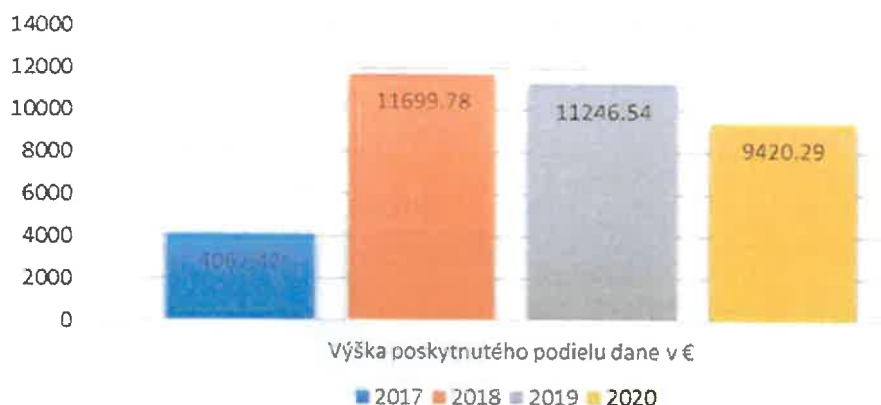
Graf č. 1 - Prehľad výšky 2 % podielu poskytnutej dane z príjmu za roky 2017 - 2020