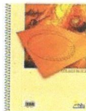
Ukážka a vzorového notesa